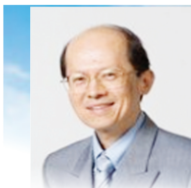
新加坡陈英俊医生供稿